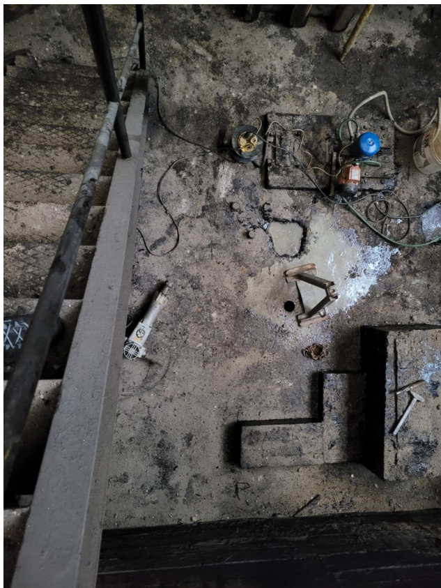
Jímka stáčiště mazutu