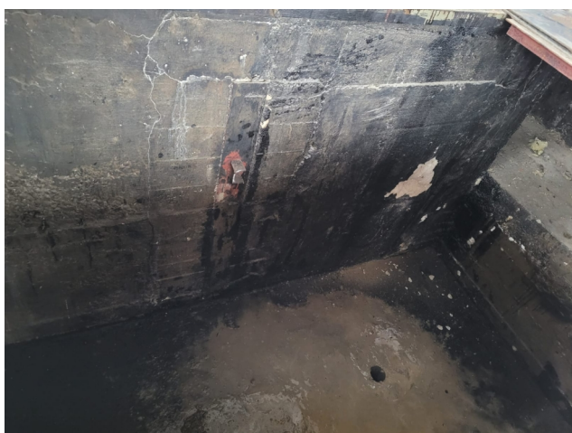
Kanál s dírou po vrtu