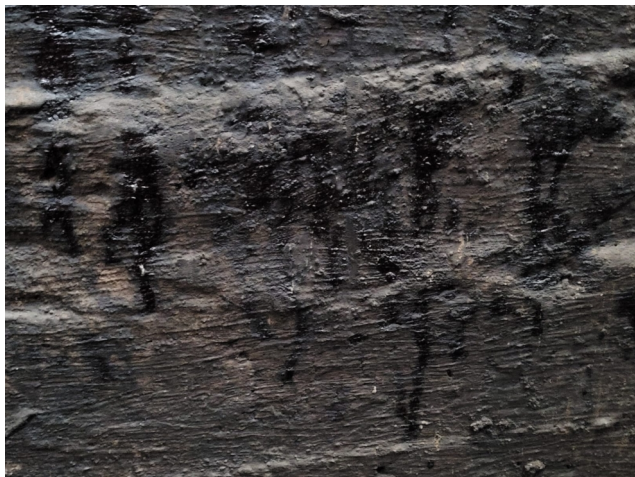
Kontaminované stěny 2