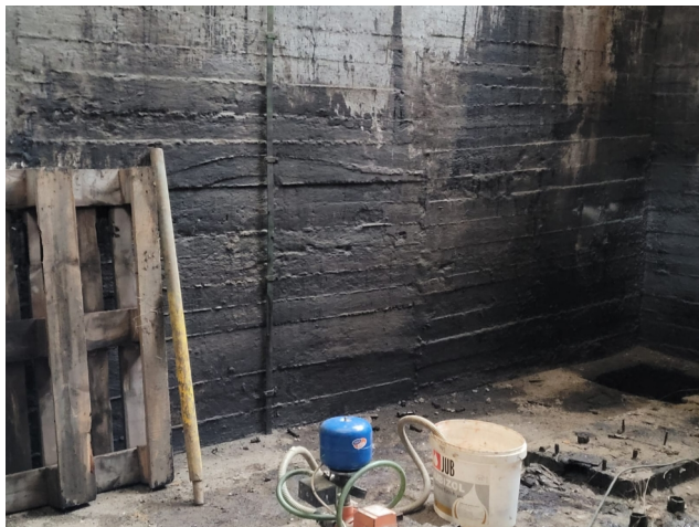
Kontaminované stěny 3