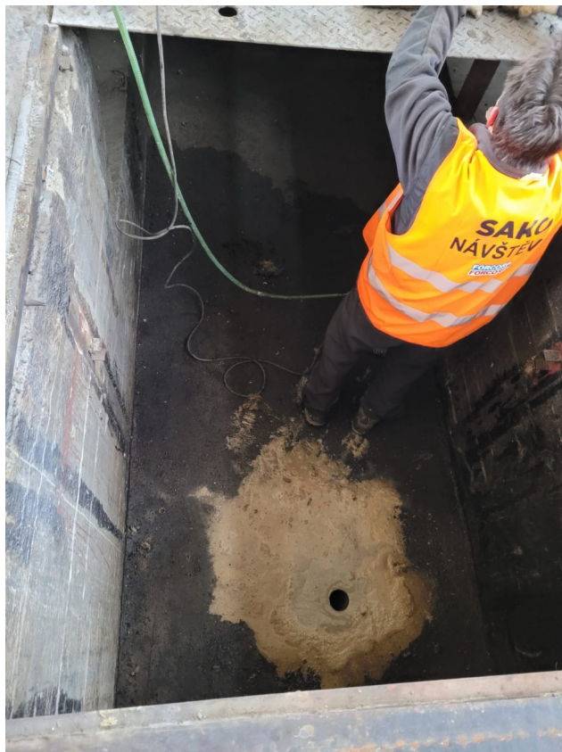
Kanál s dírou po vrtu 2