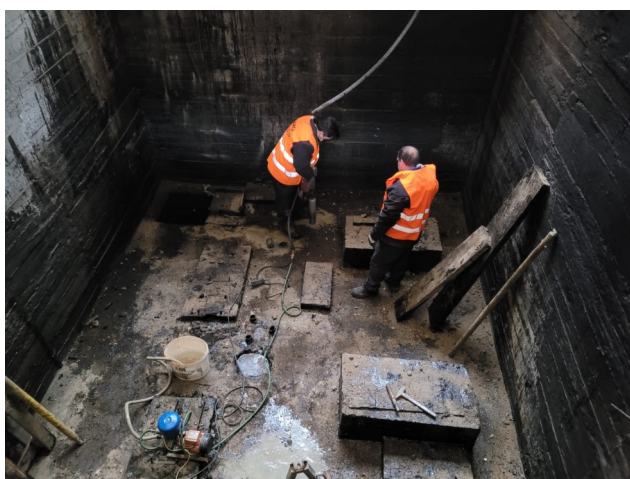
Vrtání vrtu V2